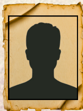
POSTE VACANT, VICE-PRÉSIDENTE ADMIN.

✉ vpclinique@scfp2960.ca ☎ poste #2961 à l'interne/514-881-3756