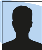
POSTE VACANT, VICE-PRÉSIDENTE ADMIN.